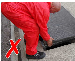
Pericolosa manovra di sollevamento senza il dispositivo di sollevamento Fibrelite

Il carico è mantenuto in prossimità del corpo in modo da prevenire infortuni alla schiena, una delle principali cause di malattia e di assenza dal lavoro per gli operatori. Il peso più alto del pannello più grande è di 25 kg!