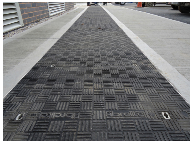
I chiusini in composito Fibrelite non corrodono o deteriorano come i chiusini in cemento o ghisa

I chiusini modulari hanno una larghezza standard di 450 mm con una gamma di lunghezza da 800 mm a 1600 mm. In caso di aperture maggiori, si possono installare opportune putrelle in acciaio.