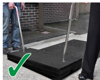
Apertura in sicurezza con il dispositivo di sollevamento FL7

Testimonianza di un cliente: "Sono stato molto impressionato da quanto facile è stata l'installazione e non potevo credere quanto leggeri fossero i coperchi, anche se potevano reggere un carico di 4,0 tonnellate!"