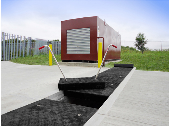
I chiusini modulari Fibrelite FM45 ed il sistema di apertura FL7

Fibrelite ha recentemente fornito in un aeroporto inglese 44 chiusini modulari modello FM45-80 (classe di carico D400) con relativi telai in alluminio. I chiusini Fibrelite sono stati scelti da un prestigioso studio di architetti e sono stati installati dalla R&M Developments.