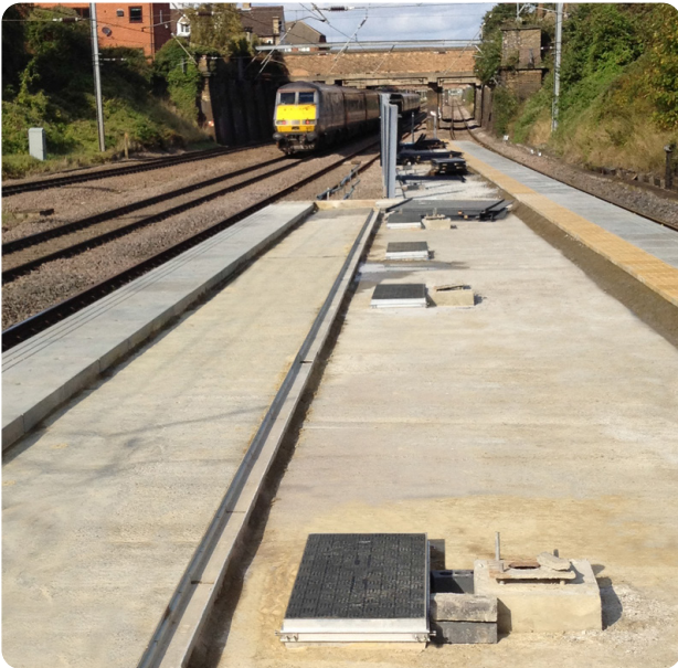
Quai de gare avec 4 tampons Fibrelite (installation réalisée à moitié)

Fibrelite est en train de fournir les premiers tampons en matériau composite de 900 x 450mm installés en milieu ferroviaire. Ils permettront ainsi un accès plus aisé au boîtier de raccordement électrique et aux puits de tirage de câble contenant les équipements de signalisation sur le quai de la gare.