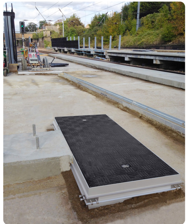
D'autres tampons Fibrelite installés sur un quai de gare

Pour plus d'informations sur la gamme des produits Fibrelite, n'hésitez pas à nous contacter: