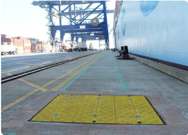
Die 90 t belastbare, leichte Faserverbund-Schachtabdeckung vor einem Kai

Die Aufgabenstellung war eine nachrüstbare, 90 t belastbare Abdeckung zu liefern, die den ständigen Umgebungseinflüssen an einem sehr umschlagsstarken Handelshafen standhält.