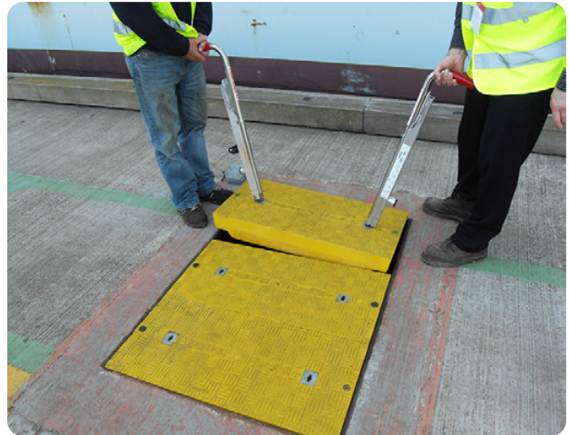
Einfaches und sicheres Herausheben mit dem speziellen Aushebewerkzeug

Die Ersatzabdeckungen die man in Faserverbundwerkstoff geliefert hatte, erfüllen die Belastungsklasse F 900 und sind Gelb eingefärbt worden, da dies Vorort der Hinweis für einen Trinkwasserzugang darstellt. Die regionale Wasserbehörde hatte eine vor unautorisiertem Zugriff gesicherte Abdeckung gefordert, so dass eine verschraubte Version eingesetzt wurde. Daraufhin hat man die Schachtabdeckung in den bestehenden Rahmen eingebaut.