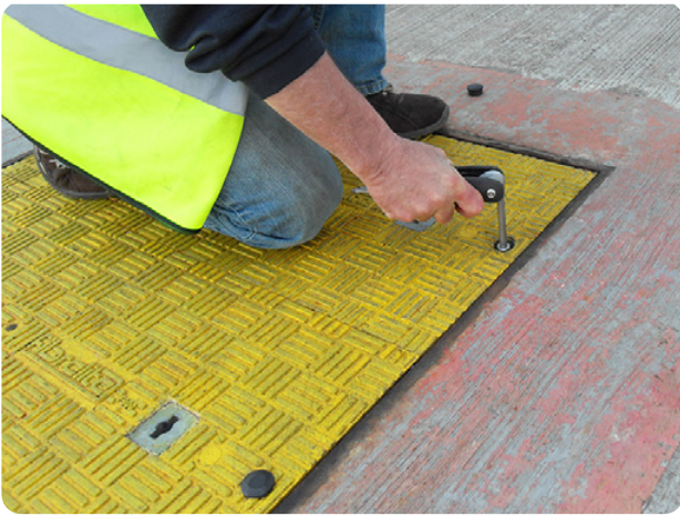
Ein Mitarbeiter öffnet den Sicherheitsverschluss