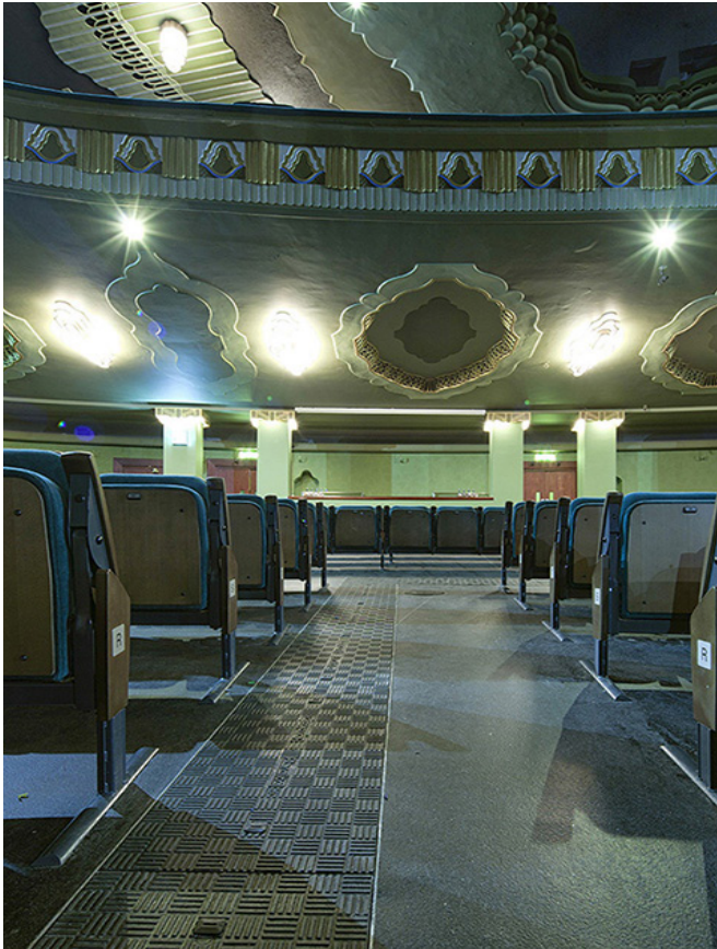
Ocho tapas livianas Fibrelite

Los arquitectos (Foster Wilson Architects LLP) que dirigieron el proyecto de remodelación del teatro realizaron un diseño práctico y discreto canalizando los cables multipar desde el escenario hasta la sala de control por el suelo. Antes, los cables discurrían por el exterior a la vista perjudicando el precioso interior del teatro.