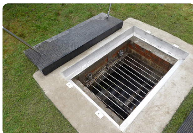
Bezpieczny i łatwy ręczny demontaż: Pokrywy Fibrelite FM45 są przenoszone ręcznie