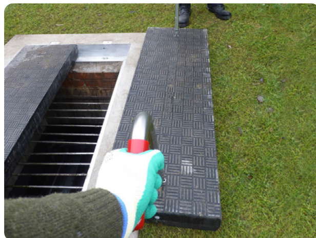
Specjalnie zaprojektowany uchwyt Fibrelite