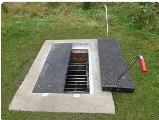
Bezobsługowe i niezmechanizowane części: Fibrelite FM45 panele do wykopów