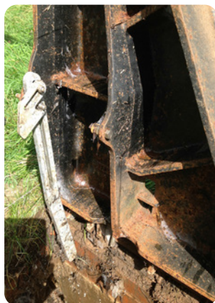
Zawodzące, ciężkie, metalowe pokrywy do podziemnych przewodów gazowych oraz mechaniczne podpory sprężynowe stanowią poważne ryzyko urazów przy pracy.