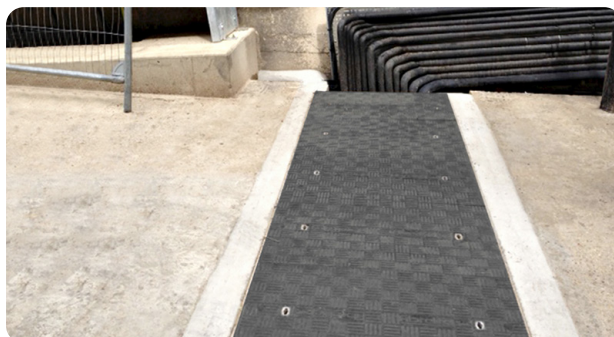
Pour faciliter l'installation et permettre une meilleure surface d'appui, Fibrelite fournit également un cadre en aluminium spécialement conçu.

Avec de nombreuses longueurs, largeurs et profondeurs disponibles, ainsi que l'option permettant de le décliner en plusieurs coloris et d'ajouter un logo, les trappes d'accès Fibrelite offrent une solution polyvalente. Tous les tampons sont fabriqués selon la norme européenne 124, avec une capacité de charge allant de l'A15 (1.5 tonnes, pour les zones piétonnes) à l'E600 (60 tonnes). Les tampons Fibrelite conviennent pour de nombreuses applications telles que : les stades sportifs, les stations d'épuration, les réseaux de tuyauterie souterrains, les aéroports, les ports ainsi que les chantiers navals.