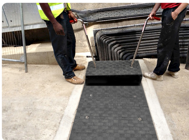
La légèreté des tampons et leur manipulation en position debout permettent un déplacement aisé et un accès en toute sécurité aux réseaux de tuyauterie souterrain.

Pour plus d'informations sur la gamme des produits Fibrelite, n'hésitez pas à nous contacter: